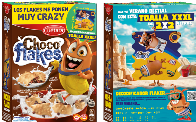
Imagen de los envases promocionales:

La PROMOCIÓN se comunicará en los ENVASES PROMOCIONALES y en la web https://chocoflakes.com también podría comunicarse a través de otras vías que CUÉTARA considere apropiadas o necesarias.